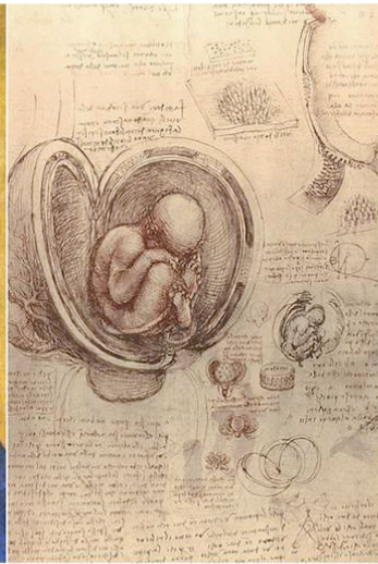
Leonardo Da Vinci, "Disegno anatomico", 1510-1513.