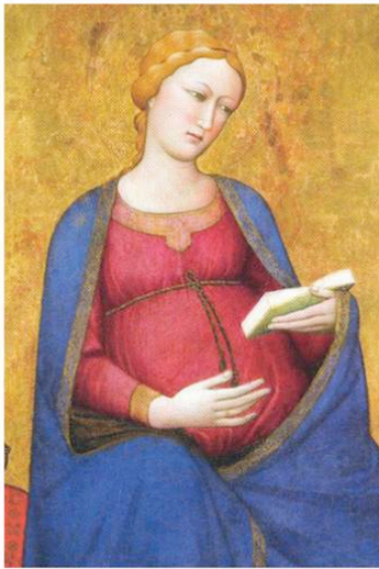
Autore del '300, "Madonna del Parto", Pieve di Montefiesole.