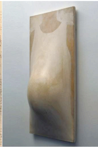
Pino Pascali, "Maternità", 1964, courtesy MACRO Roma.